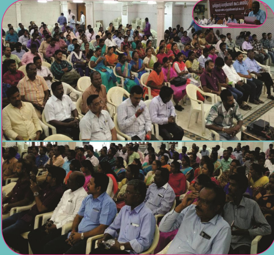
Tamil Nadu Engineers Federation, Villupuram Region Meeting held on 16.12.2017