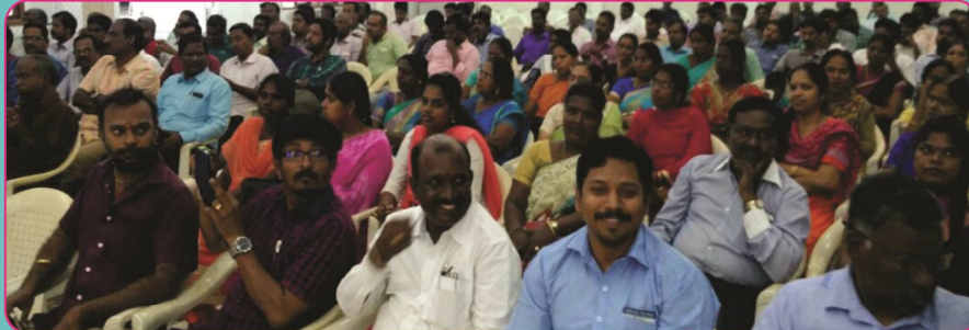
Gathering of TNEF Meeting held at Villupuram