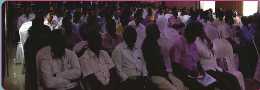
Gathering of TNEF Meeting held at Tirunelveli