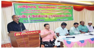
நெல்லைவில் பொறியாளர் கூட்டமைப்பு மண்டல ஒருங்கிணைப்புக் கூட்டம் நடந்தது.

நெல்லை, தூத்துக்குடி, கன்னியாகுமரி மாவட்டங்களில் பொதுப்பணித் துறை, நெடுஞ்சாலைத் துறை, ஊரக வளர்ச்சித் துறை, நெடுநிலைப் பழுது கட்டுப்பாட்டுத் துறை, வேளாண் பொறியியல் துறை, மின் ஆய்வுத்துறை, மின்வாரியம், குடிசை மாற்று வாரியம், வீட்டு வசதி வாரியம், போக்குவரத்துக்