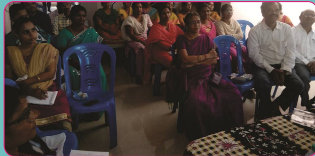
Gathering of Branch Meeting held at Tharamani