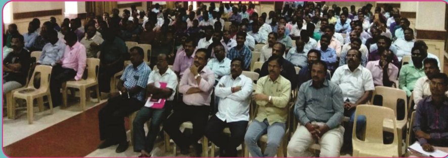
Gathering of TNEF Meeting held at Trichy