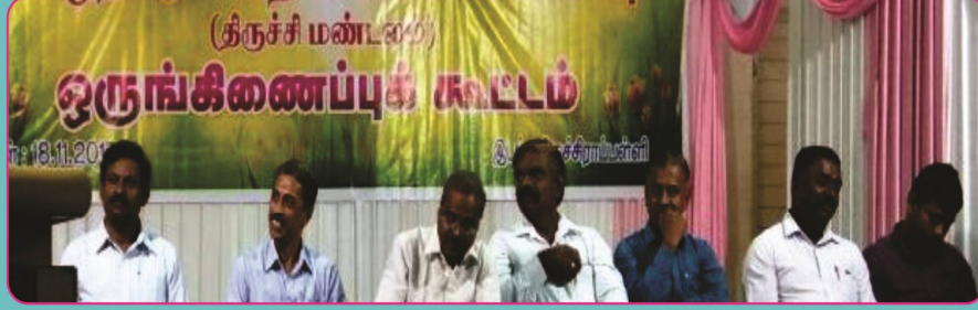
Tamil Nadu Engineers Federation, Trichy Region Meeting held on 18.11.2017

PORIYALAR, Egmore RMS / 1 Patrika, Chennai Reg. No.T.N. / CH (C) / 307 / 15 - 17 Posted on : 22.12.2017, Licensed to Post without prepayment under WPP No.TN/PMG(CCR), WPP No.340/15-17