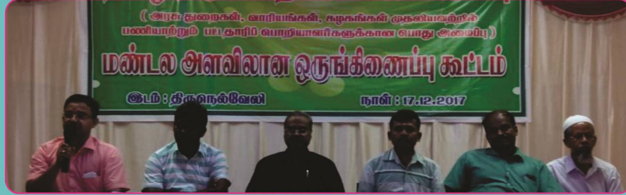
Tamil Nadu Engineers Federation, Tirunelveli Region Meeting held on 17.12.2017