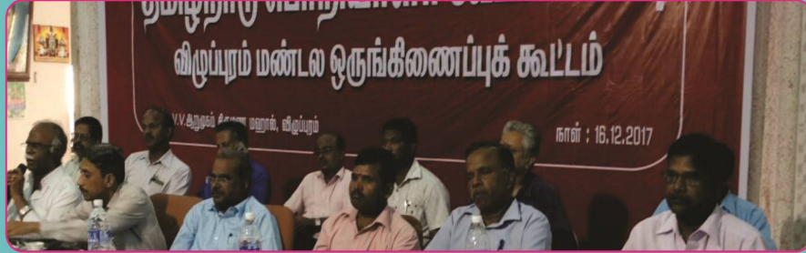
Tamil Nadu Engineers Federation, Villupuram Region Meeting held on 16.12.2017